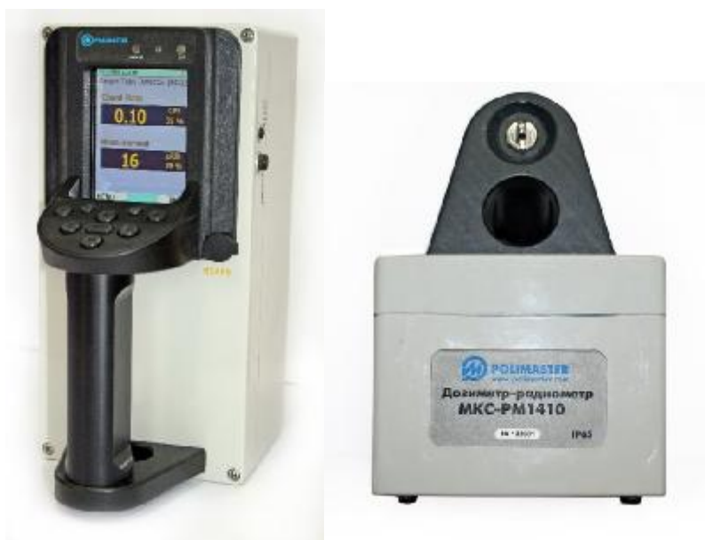
Рис. 1 Общий вид дозиметров-радиометров МКС-PM1410

Общий вид дозиметров представлен на рисунке 1, место пломбирования от несанкционированного доступа – на рисунке 2.