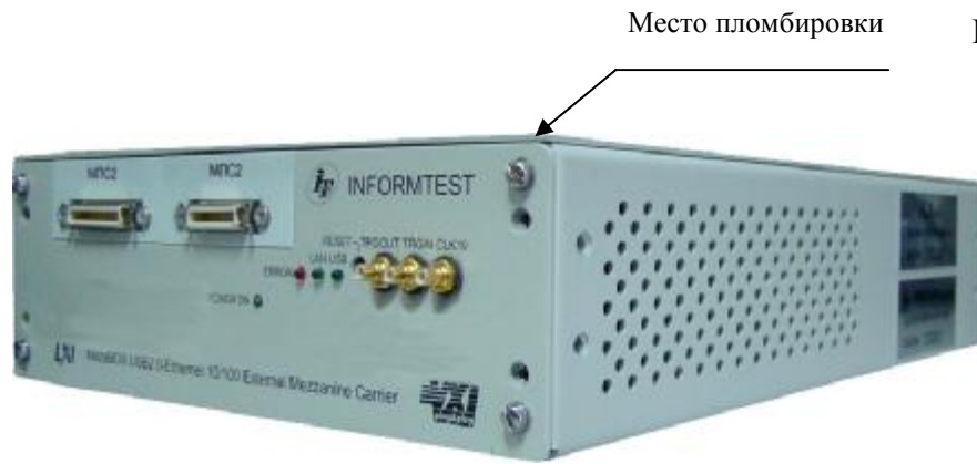
Рисунок 2 – Внешний вид устройства MezaBox с установленными магазинами