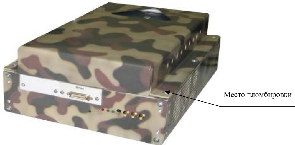
Рисунок 3 – Внешний вид устройства MezaBox\Battery 133W-hrs с установленным магазином