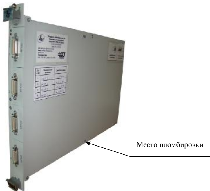
Рисунок 4 – Внешний вид носителя мезонинных модулей НМ-М с установленными магазинами