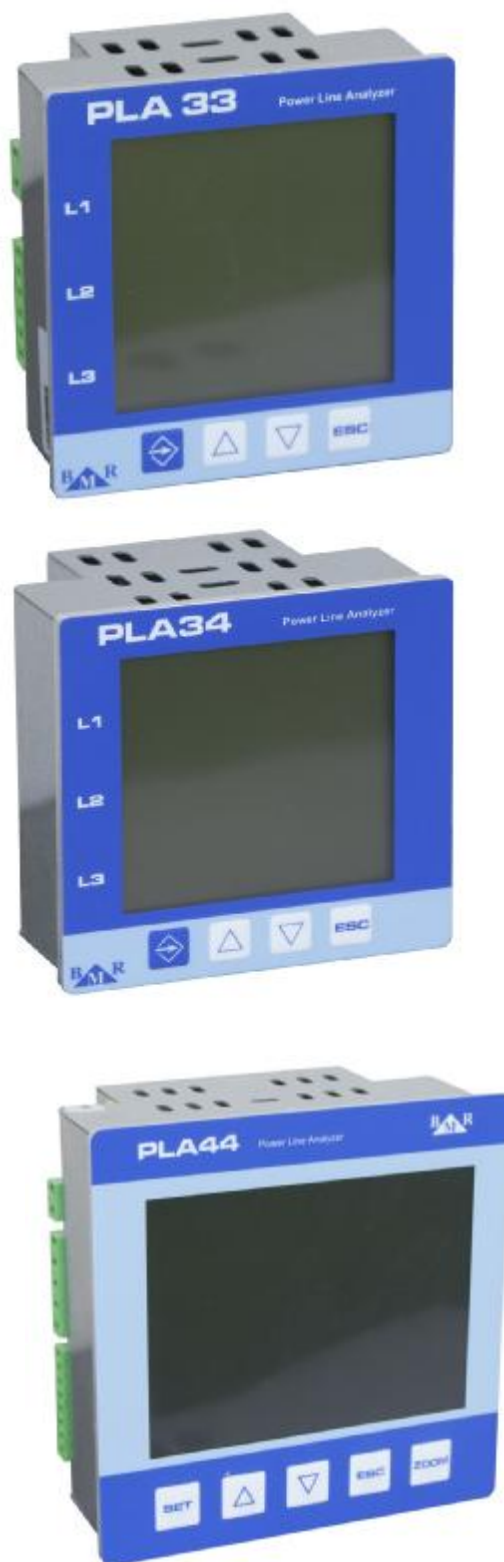
Рис.1 Общий вид анализаторов