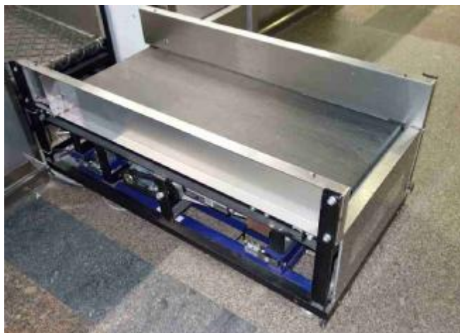
Рисунок 3 - Общий вид ГПУ весов DD7 со снятыми боковыми панелями корпуса ГПУ