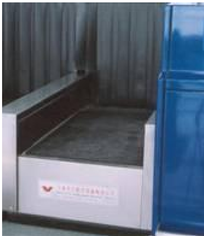
Рисунок 2 - Общий вид ГПУ весов DD7