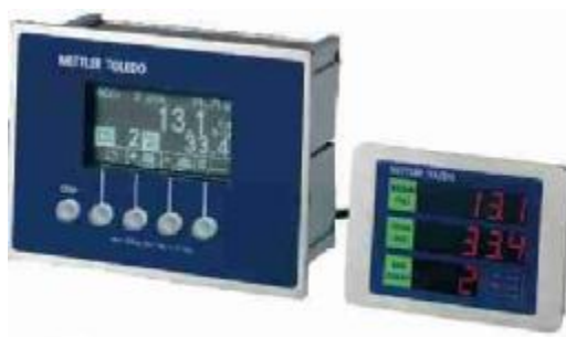
Рисунок 4 - Общий вид терминала IND205 с дополнительным индикатором

Место пломбировки весов, исключая несанкционированные настройки и вмешательства, которые могут привести к искажению результатов измерений весов, показано на рисунке 5. Опломбирование весов осуществляется путем установки проволочной пломбы на болт задней крышки корпуса весового терминала.