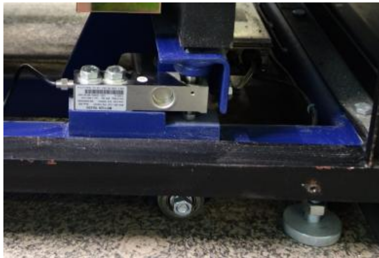
Рисунок 1 – Датчик SBH с качающейся подвеской типа «рокер-пин»

Общий вид ГПУ показан на рисунках 2 – 3, а терминала IND205 - на рисунке 4.