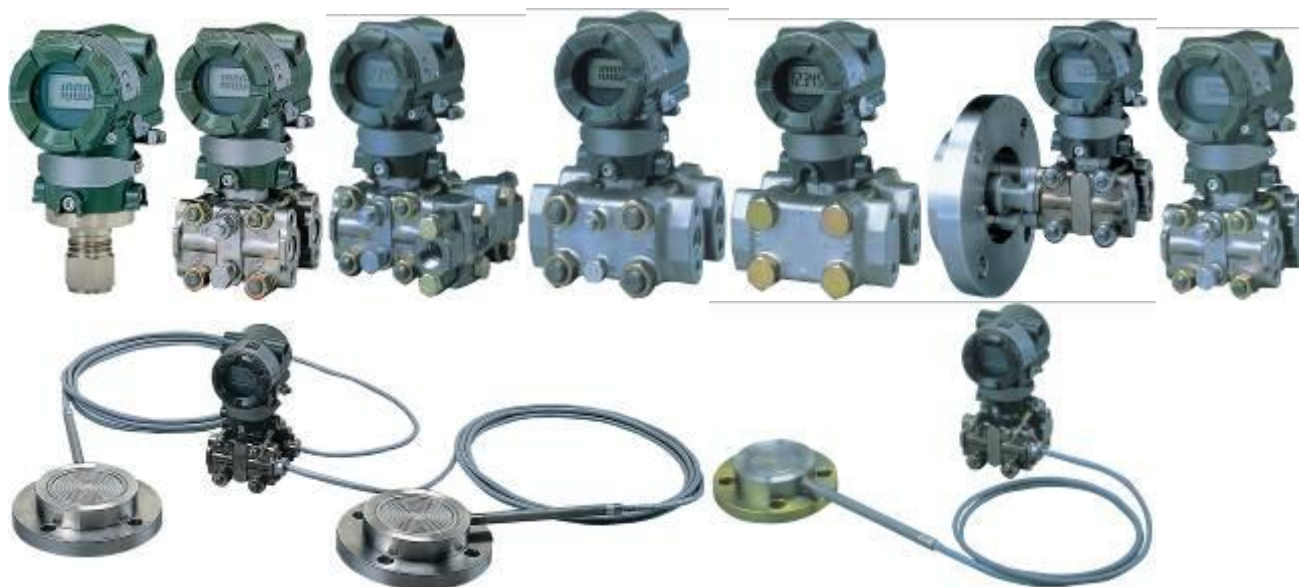
Рис. 2. Общий вид преобразователей (датчиков) давления измерительных EJA (серия А)