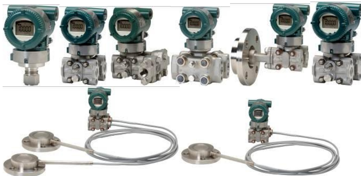
Рис. 1. Общий вид преобразователей (датчиков) давления измерительных EJX (серия А)