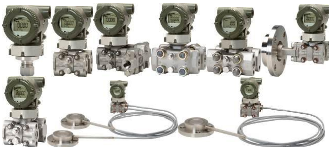
Рис. 3. Общий вид преобразователей (датчиков) давления измерительных EJA (серия Е)