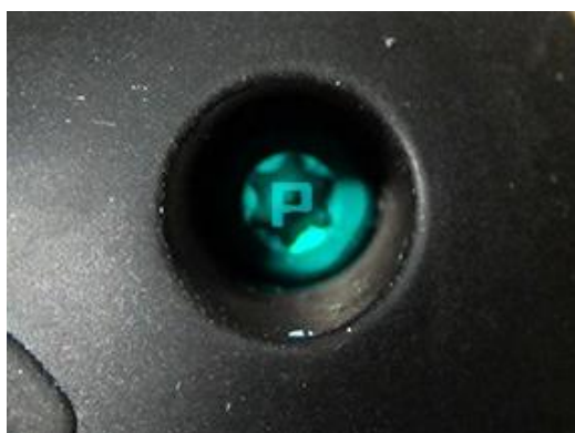
Рисунок 2 – Фото пломбы на стягивающем винте корпуса.