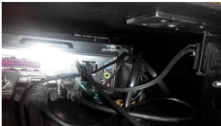
Рисунок 3 - Место пломбирования комплекса «Дозор-М», исполнение - «Дозор-М»-00