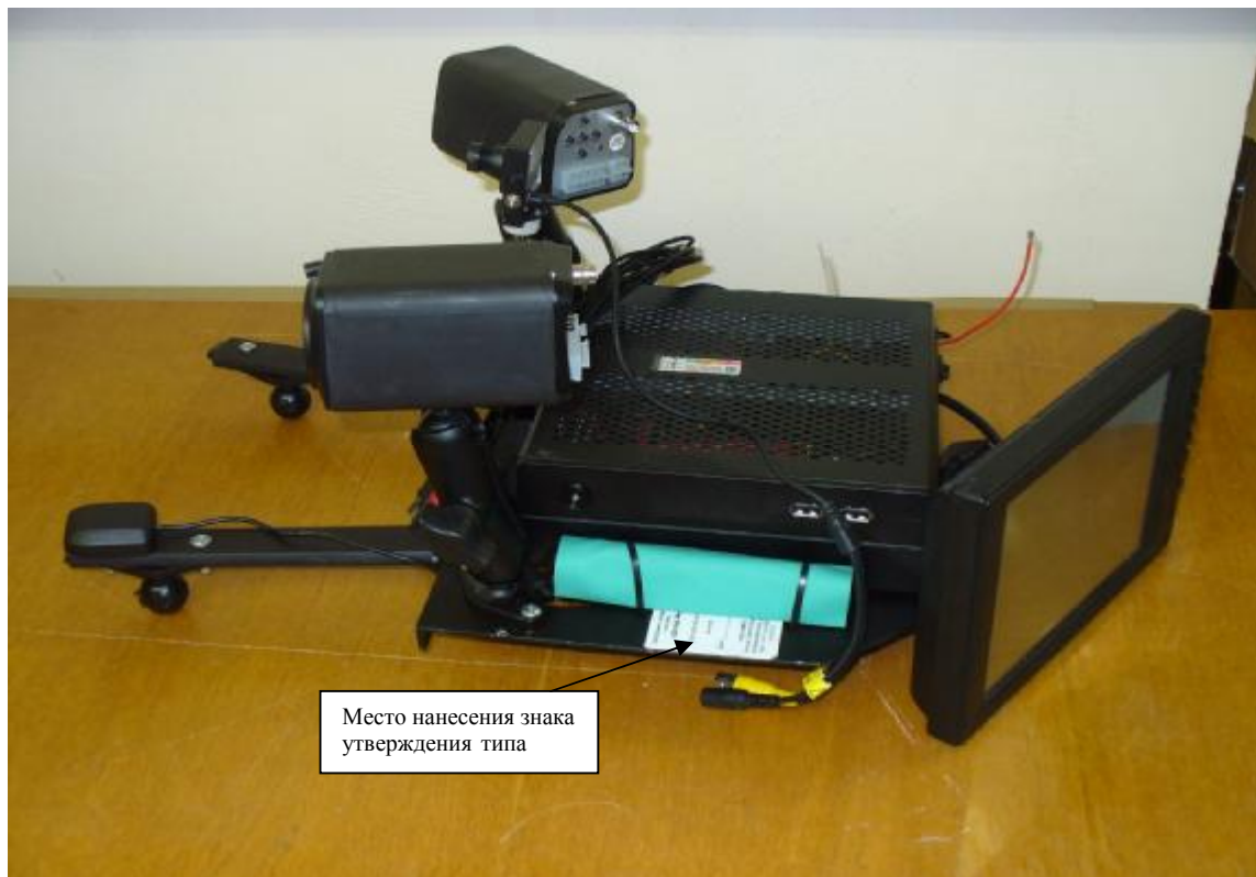
Рисунок 1 – Внешний вид комплекса «Дозор-М», исполнение - «Дозор-М»-00