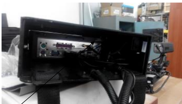
Рисунок 4 - Место пломбирования комплекса «Дозор-М», исполнение - «Дозор-М»-01