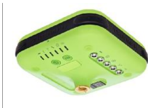
Рисунок 1 – Внешний вид приемника со стороны нижней панели

Внешний вид приемника с указанием места пломбировки от несанкционированного доступа и места нанесения знака утверждения типа приведен на рисунках 1 и 2.