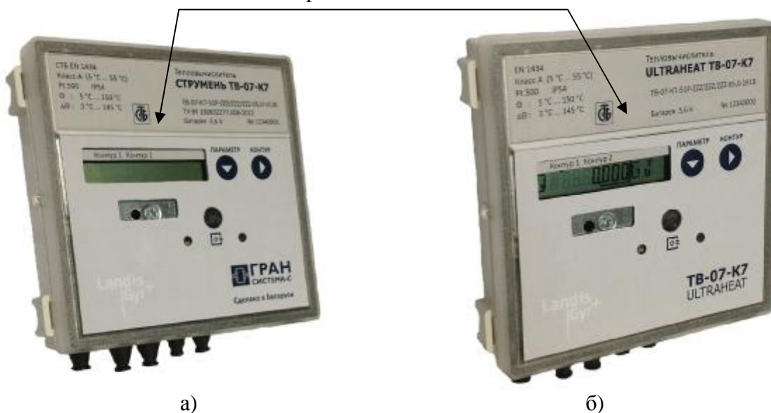
Рисунок 1 – Внешний вид тепловычислителя ТВ-07-К7, а) исполнение «СТРУМЕНЬ»; б) исполнение «ULTRAHEAT»

Место для нанесения знака утверждения типа