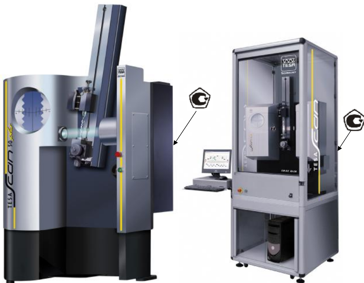
Рис. 1 - Общий вид установок для измерений параметров валов TESA SCAN