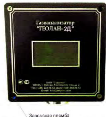
Рис. 4 Газоанализатор «Геолан-2Д»

Газоанализаторы позволяют одновременно принимать и обрабатывать измерительную информацию с 16 сенсоров. Встроенный цифровой жидкокристаллический индикатор служит для визуального контроля концентрации измеряемых веществ.