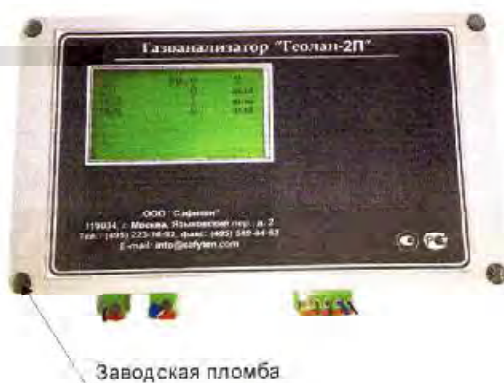
Рис. 3 Газоанализатор «Геолан-2П»