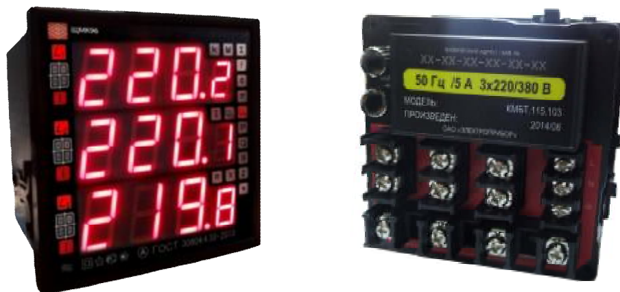
Рисунок 1 – Общий вид

Общий вид приборов, места нанесения маркировки и клейм приведены на рисунках 1, 2.