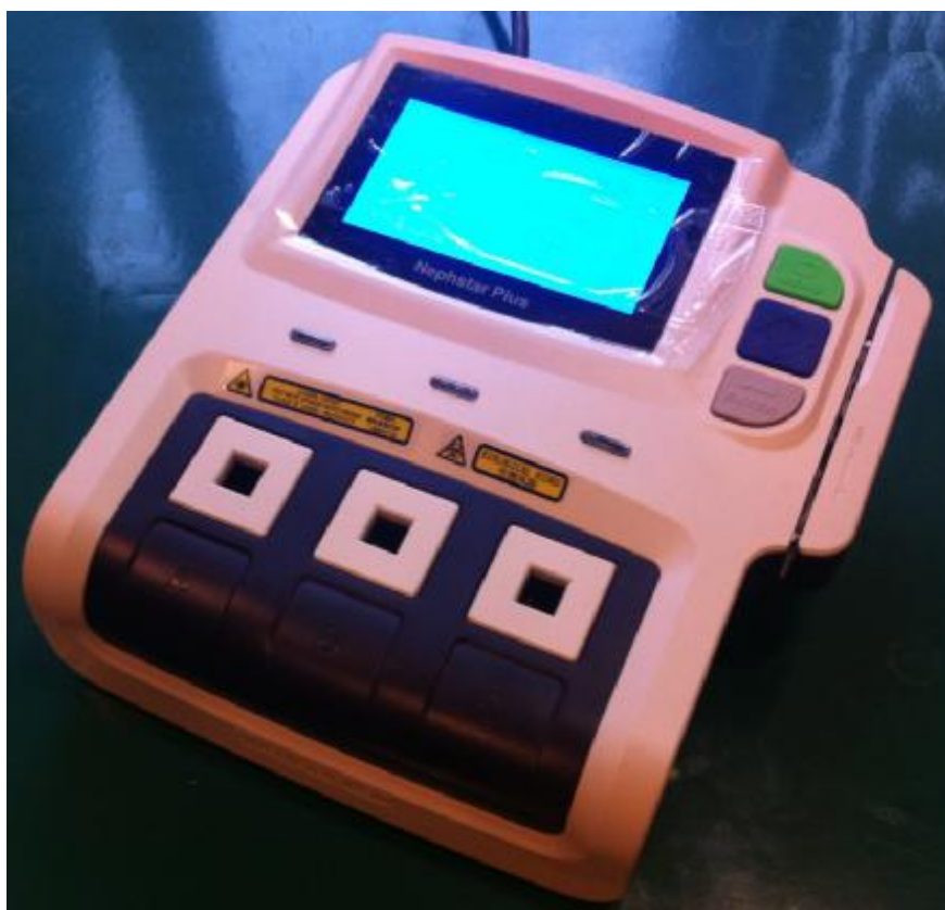
Рисунок 2 – Общий вид нефелометра модель Nephstar Plus