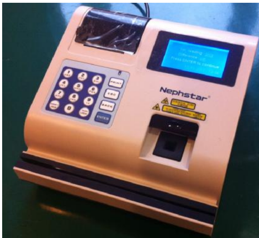
Рисунок 1 – Общий вид нефелометра модель Nephstar

Конструктивно нефелометры выполнены в виде двух блоков - блока считывания и блока обработки результатов измерений, размещенных в едином корпусе. Блок обработки результатов измерений представляет собой микрокомпьютер, предназначенный для управления системой и обработки результатов измерений с применением встроенного программного обеспечения.