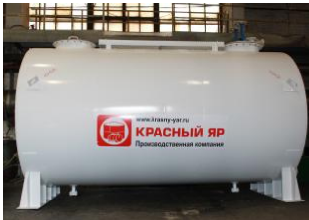
Рисунок 1 – Внешний вид резервуара и маркировочной таблички