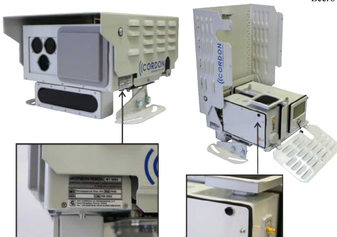
Рисунок 3 - Комплекс «КОРДОН-Темп» на базе блока «К4»