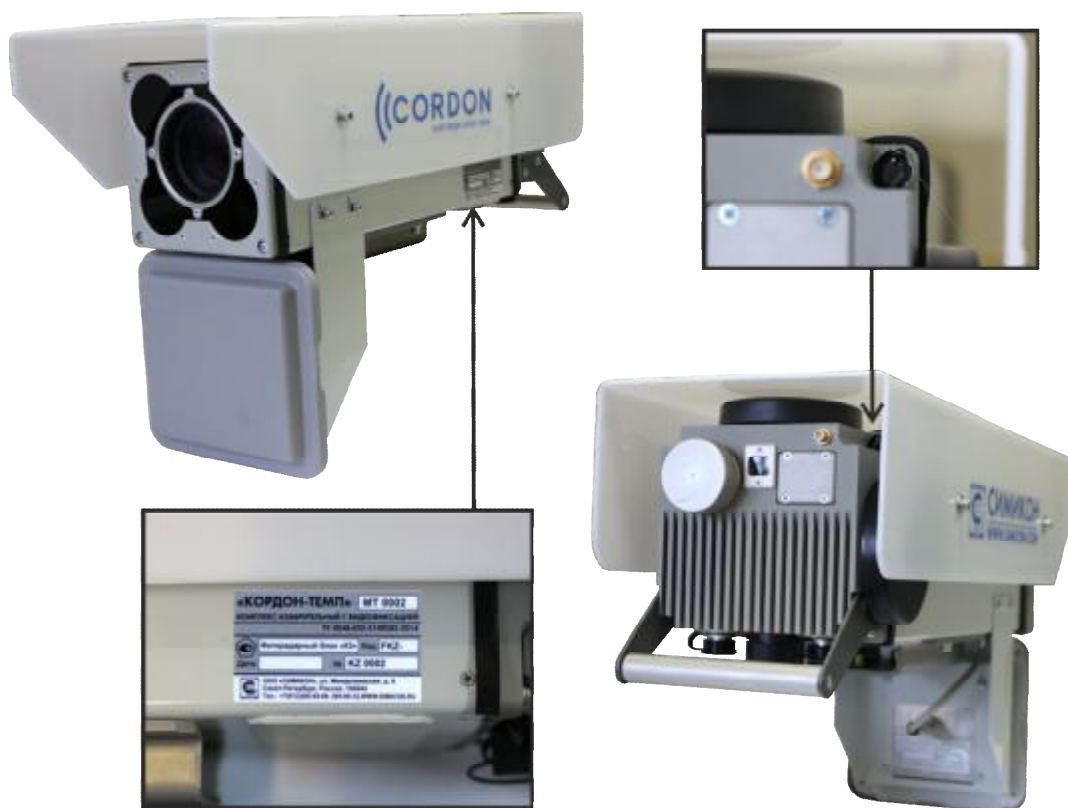
Рисунок 2 - Комплекс «КОРДОН-Темп» на базе блока «К3»