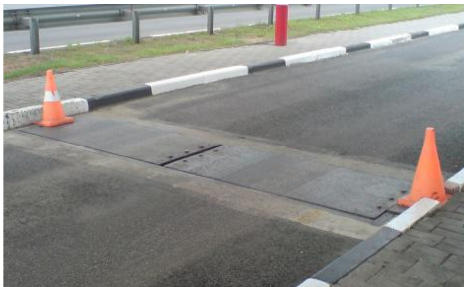
Рисунок 2 – Общий вид весов РЕЙС-Д

Форма маркировки весов: РЕЙС – [1]-[2]-[3]-[4]-[5]