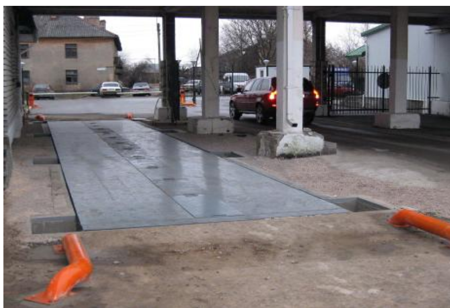
Рисунок 1 – Общий вид весов РЕЙС-С

Общий вид весов автомобильных РЕЙС представлен на рисунках 1, 2.