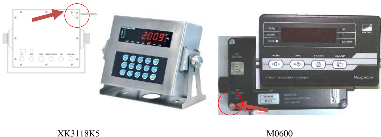
Рисунок 3 – Общий вид приборов и схемы их пломбирования

Для идентификации метрологически значимого модуля автономного ПО «ТС-Драйвер» (стандартная комплектация) предусмотрено использование внешней программы расчёта значения хэш-функции MD5 (RFC1321).