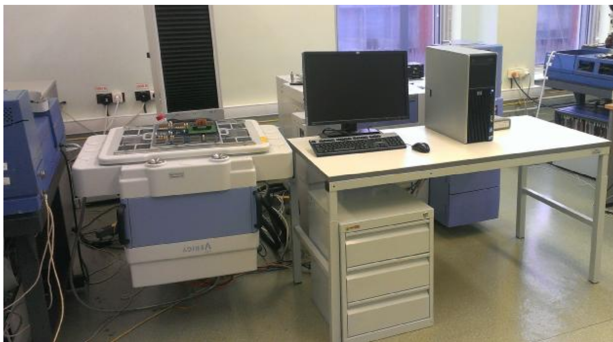
Рисунок 2 - Общий вид тестера Verigy V93000