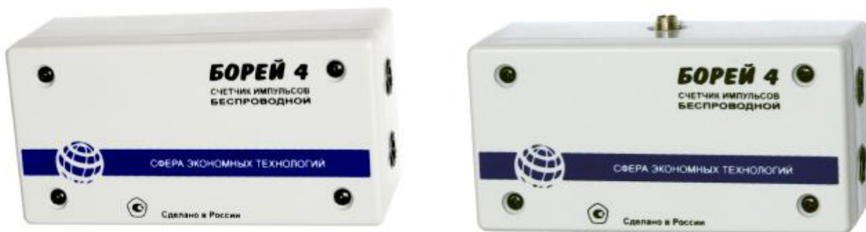
Рисунок 1 – Внешний вид счетчиков

Внешний вид и схема пломбирования приведены на рисунках 1 и 2 соответственно.