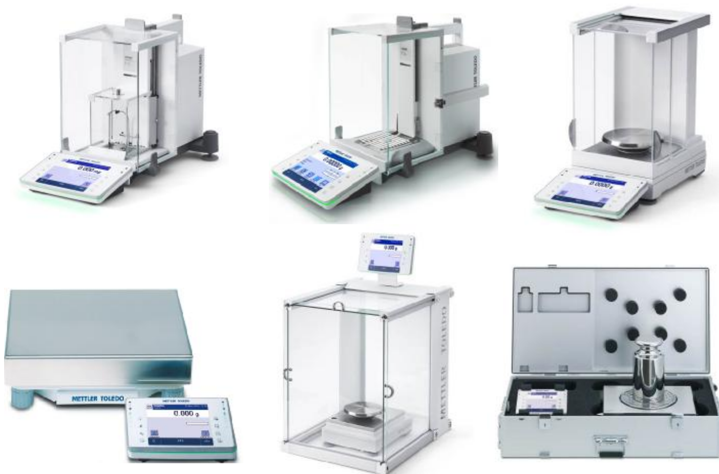
Рисунок 2 – Общий вид компараторов массы XPE