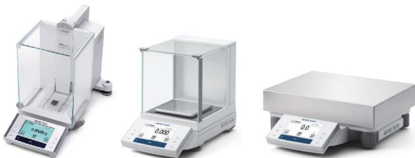
Рисунок 3 – Общий вид компараторов массы XS