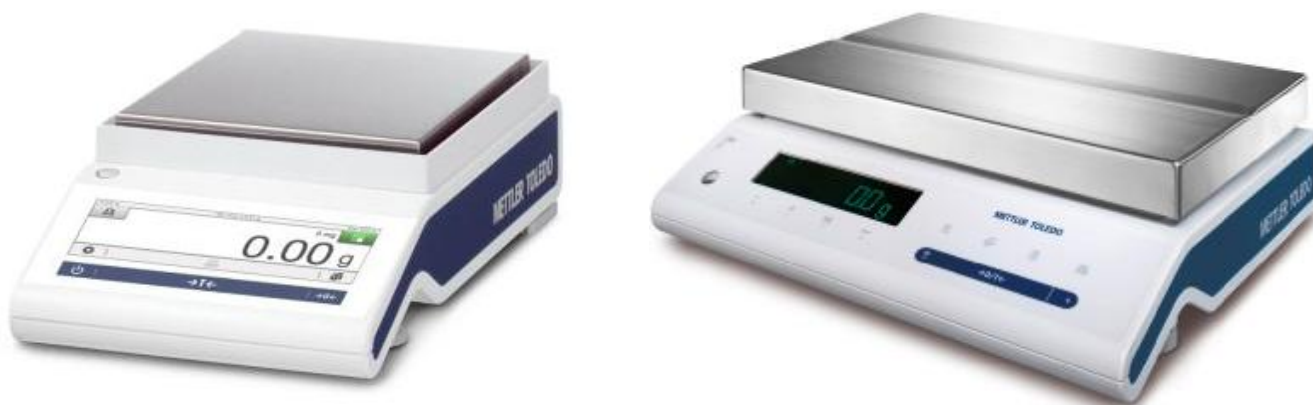
Рисунок 4 – Общий вид компараторов массы MS

Обозначение исполнения модификаций имеет вид: