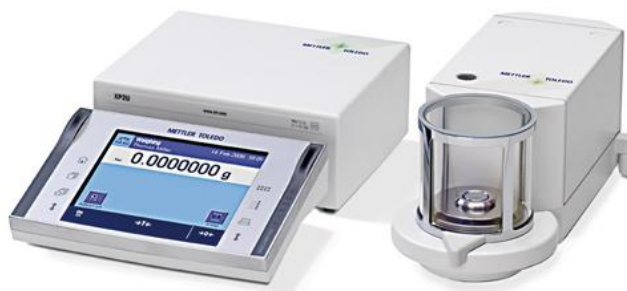
Рисунок 1 – Общий вид компараторов массы XP

Общий вид компараторов представлен на рисунках 1, 2, 3 и 4.