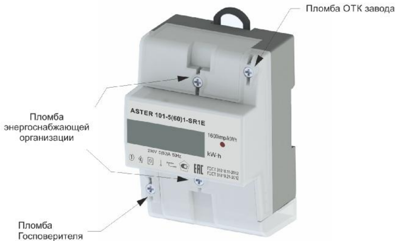
Рисунок 1 – модификация ASTER 101