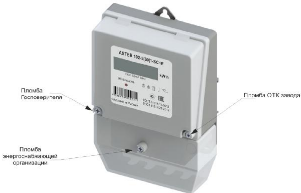
Рисунок 2 – модификация ASTER 102