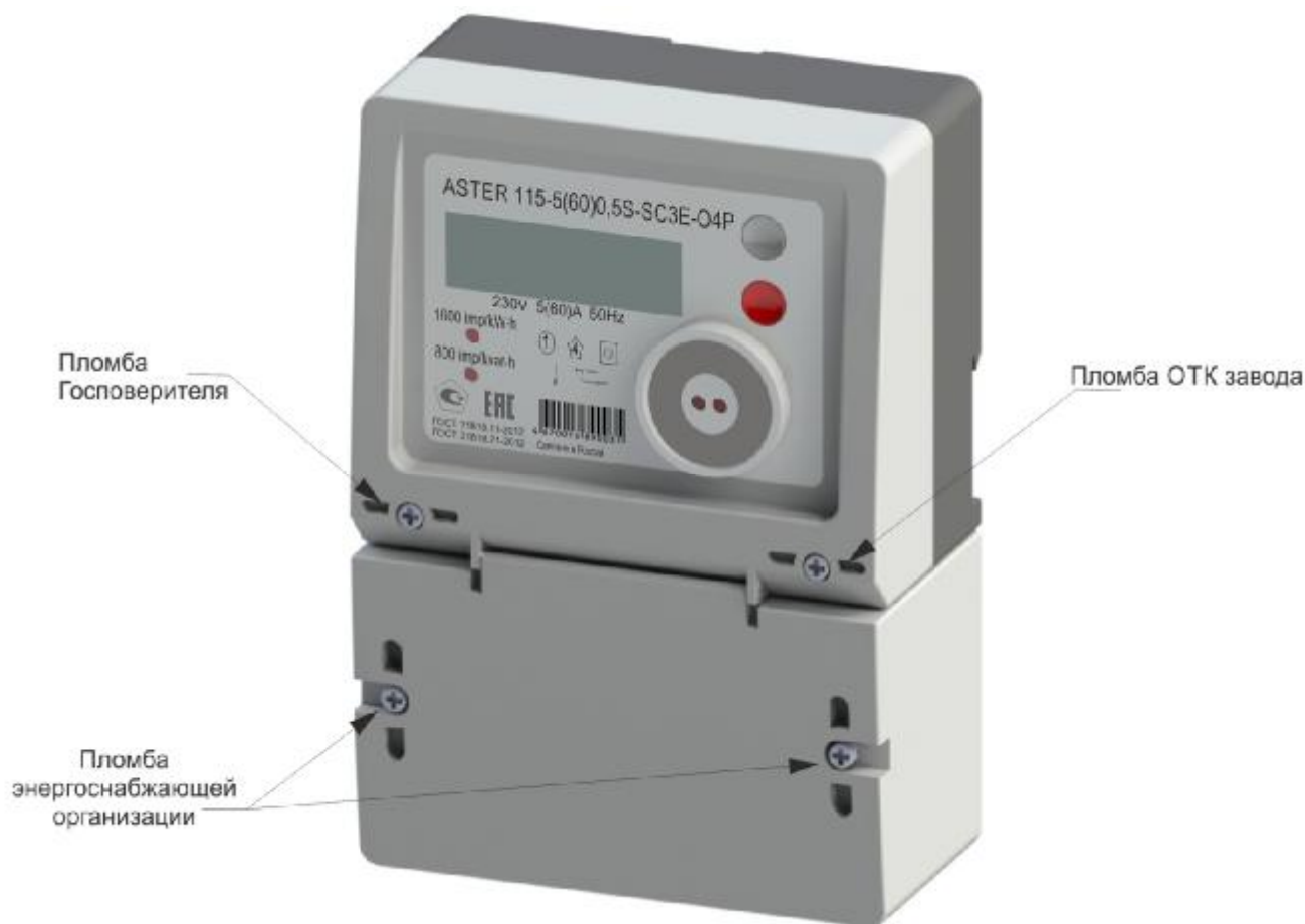
Рисунок 3 – модификация ASTER 115