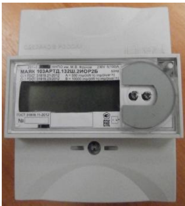
Рисунок 1 – Внешний вид счетчика с закрытой клеммной крышкой

Внешний вид счетчика МАЯК 103АРТД с закрытой клеммной крышкой приведен на рисунке 1.