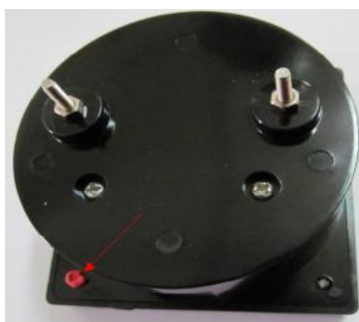
Рис. 4 Место пломбирования