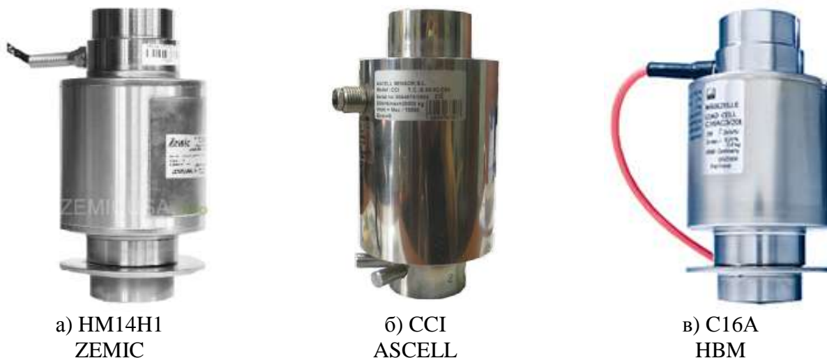
Рисунок 2 - Внешний вид датчиков тензорезисторных