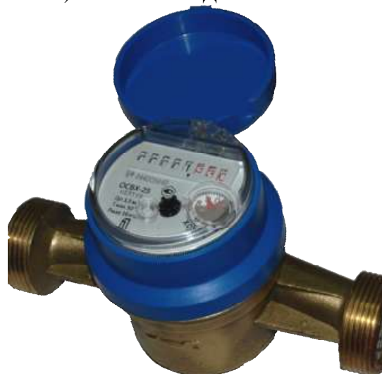
ж) ОСВХ – 25 «НЕПТУН»