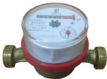
а) ВСКМ90 – 15 «АТЛАНТ»