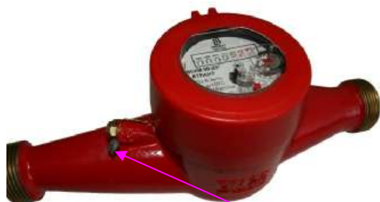
в) ВСКМ90 – 25 «АТЛАНТ»