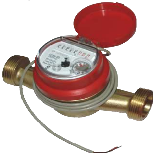
д) ОСВУ –25 ДГ «НЕПТУН»