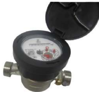
б) ВСКМ 90 - 15 «АТЛАНТ»