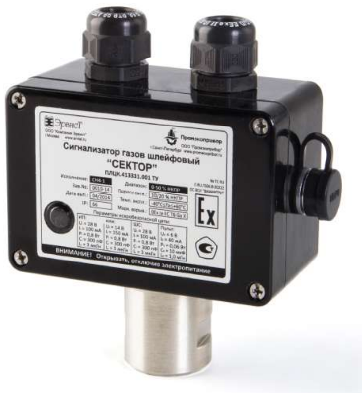
Рисунок 1 – Внешний вид сигнализаторов «Сектор»