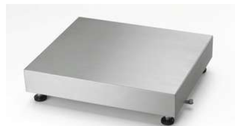
PBA220; PBA226; PBA426; PBA429