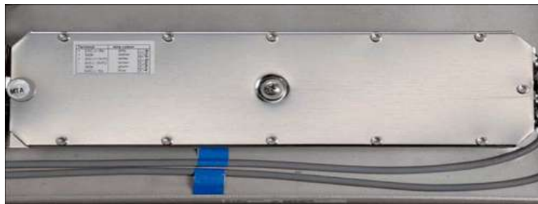
Рисунок 5 – Место пломбирования ГПУ