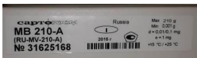
Рисунок 3 –Маркировка весов

Маркировка весов производится на фирменной табличке (Рис. 3).