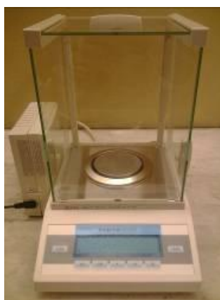
Рисунок 2 – Общий вид весов