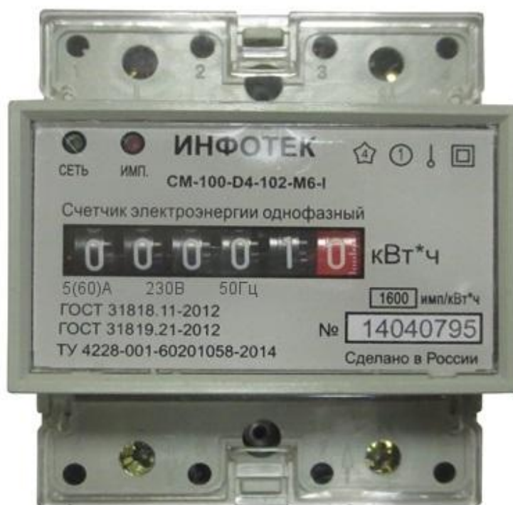
б) Тип корпуса D4 для установки на DIN-рейку