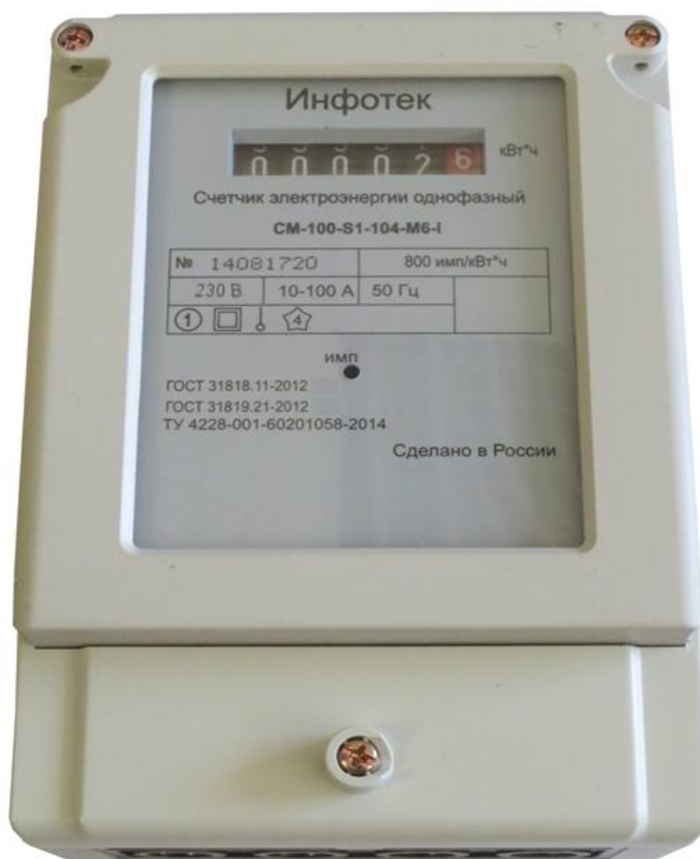
в) Тип корпуса S1 настенное исполнение