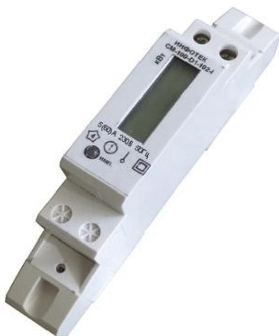
а) Тип корпуса D1 для установки на DIN-рейку