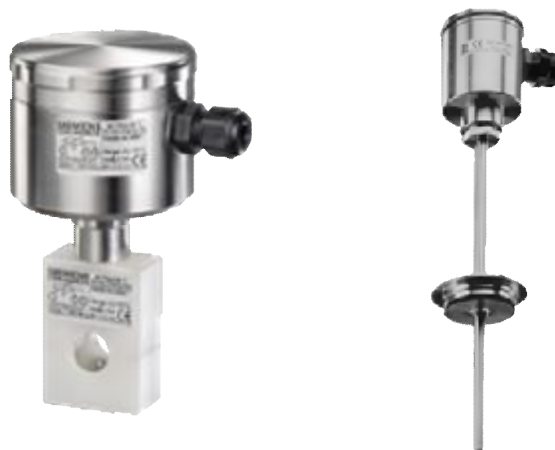
Рис.2 SITRANS TS300