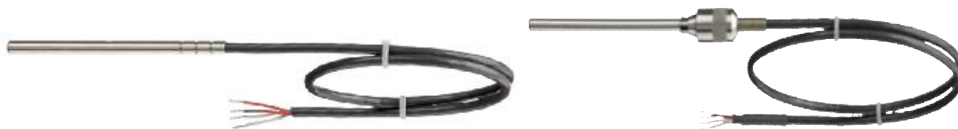
Рис.4 SITRANS TS100