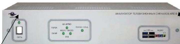
Рисунок 1 Общий вид анализаторов АТС-3 -1, АТС-3-2, АТС-3-7