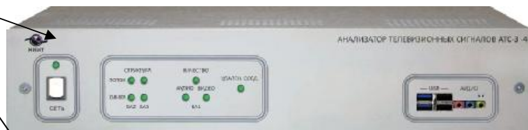
Рисунок 3 Общий вид анализатора АТС-3 -4, АТС-3 -5