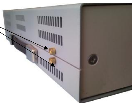
Рисунок 5 Пломбировка анализаторов