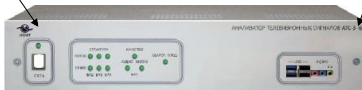
Рисунок 4 Общий вид анализатора АТС-3-6