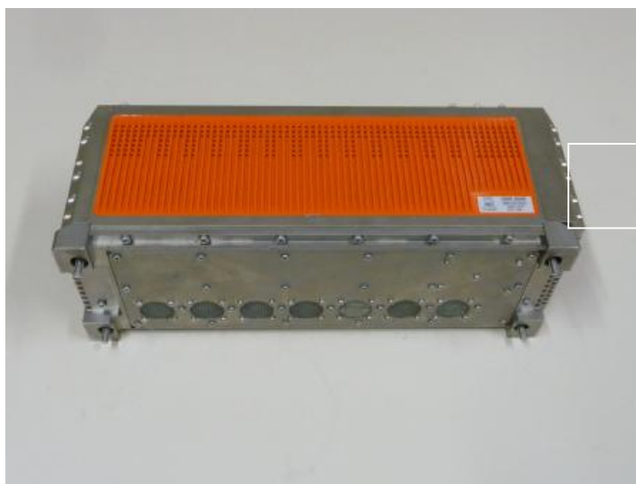
Рисунок 2 - Внешний вид блока измерительного UMA07B (вид сбоку)