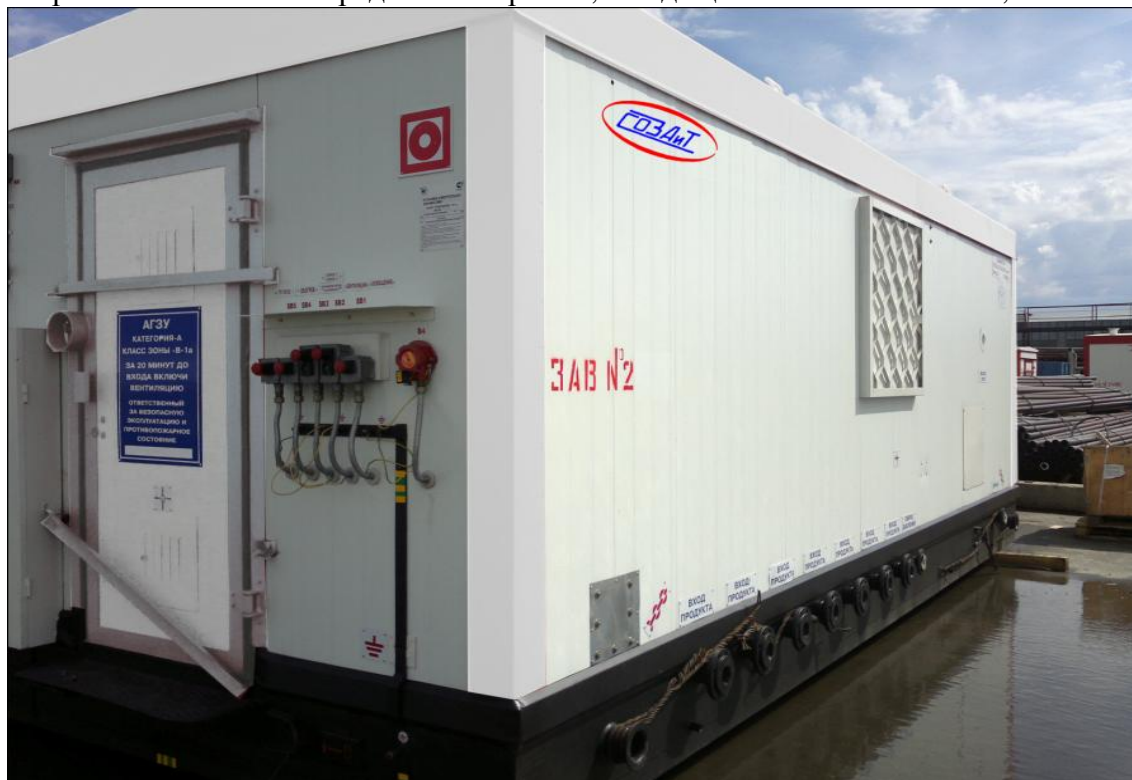
Рисунок 1 - Внешний вид установки АГЗУ

Аппаратурный отсек АГЗУ содержит шкаф контроля и управления с вторичными блоками средств измерений, входящими в состав АГЗУ, силовой шкаф.