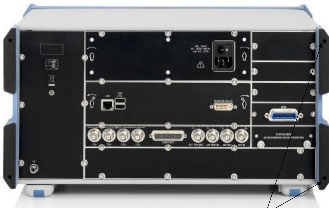
Рисунок 1 – Внешний вид анализаторов цепей векторных ZND

места пломбировки от несанкционированного доступа