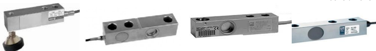
а) H8C (ZEMIC) б) SQB (KELI) в) HLC (HBM) г) BS (CAS)