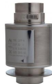
ж) ZSFY (KELI)