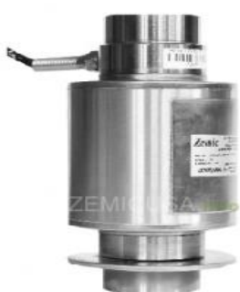
а) HM14H1 (ZEMIC)