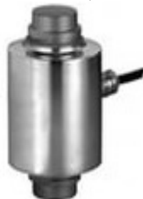
е) RS3 (FLINTEC)