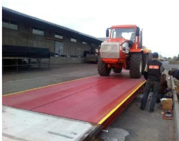
а) «классические» б) «разборные» Рисунок 1 - Внешний вид весов ВАЭЛ с датчиками колонного типа