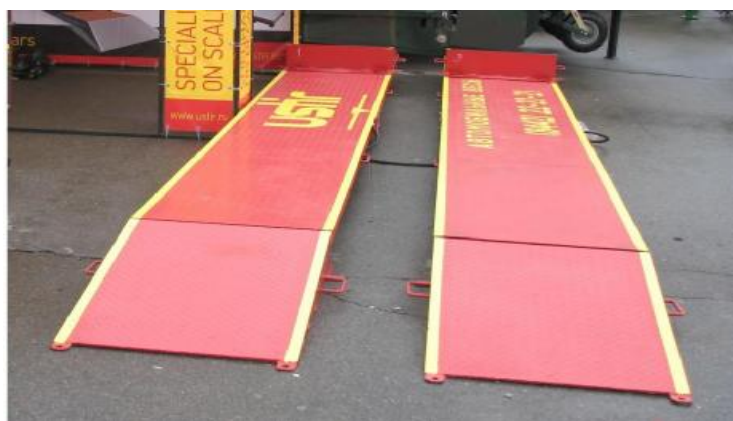
«передвижные» Рисунок 3 - Внешний вид весов ВАЭЛ с датчиками балочного типа