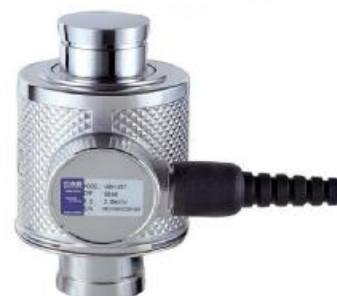
в) WBK и WBK-D (CAS)