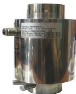
б) CCI и CCI-D (ASCCELL)