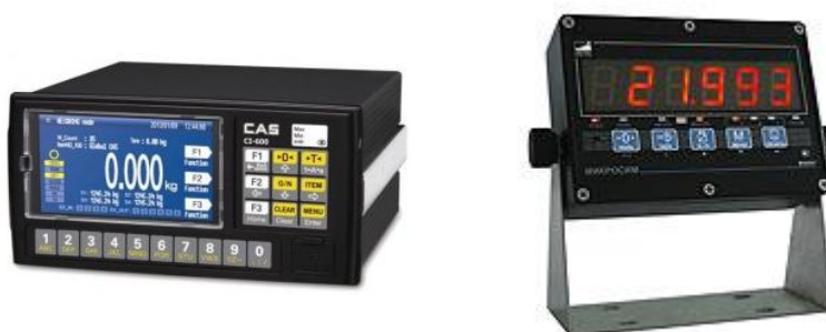
г) CI-600D (CAS) д) Микросим-0600 (Метра)