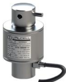
г) 740 и 740D (UTILCELL)