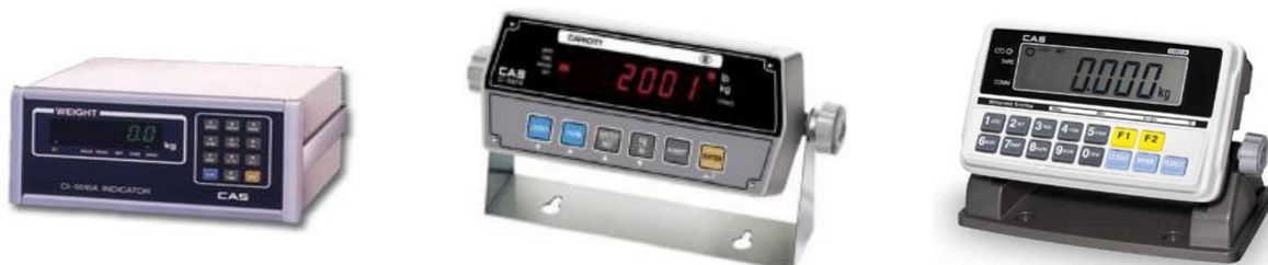
а) CI-5010A (CAS) б) CI-2001A (CAS) в) CI-200D (CAS)