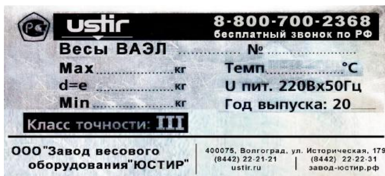
Рисунок 6 - Внешний вид маркировочной таблички