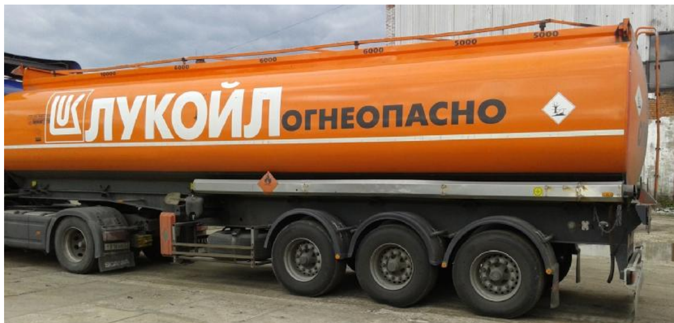
Рисунок 1 - Общий вид полуприцепа-цистерны ALI RIZA USTA A3TY

На боковых сторонах и сзади цистерна имеет надпись «ОГНЕОПАСНО», знак ограничения скорости и знаки с информационными табличками для обозначения транспортного средства, перевозящего опасный груз.