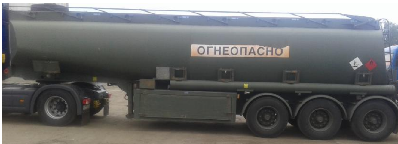
Рисунок 1 - Общий вид полуприцепа-цистерны THOMPSON CARMICHAEL PT44/3

На боковых сторонах и сзади цистерна имеет надпись «ОГНЕОПАСНО», знак ограничения скорости и знаки с информационными табличками для обозначения транспортного средства, перевозящего опасный груз.