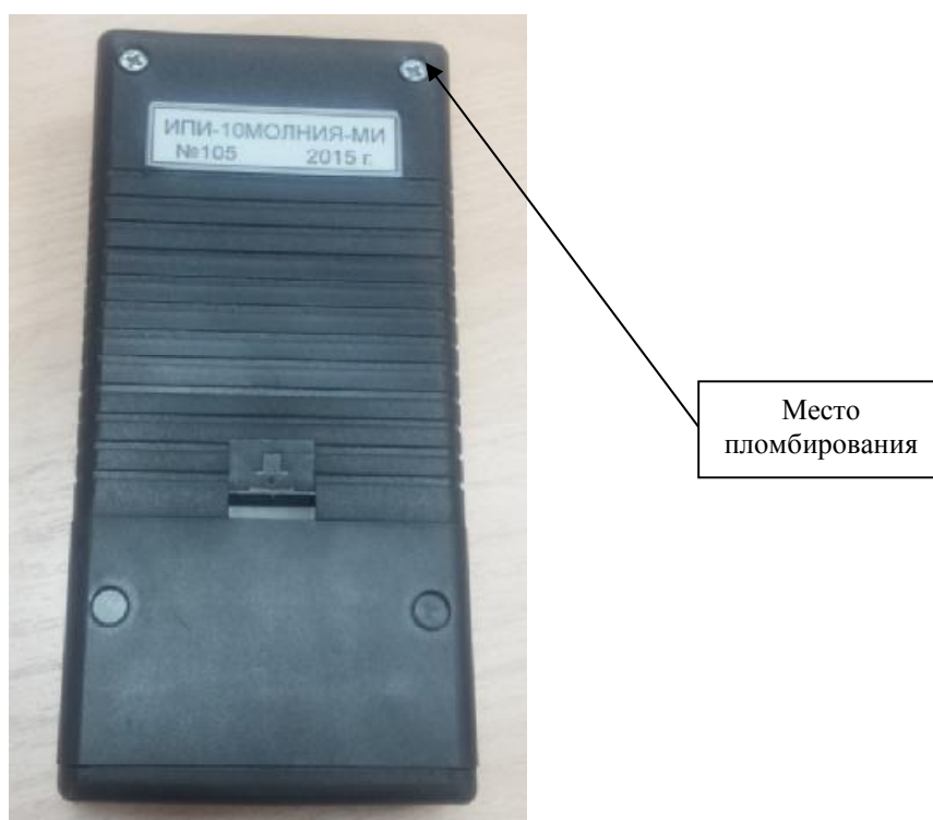
Рисунок 2 – Внешний вид и место пломбирования ИПИ-10-МОЛНИЯ-МИ