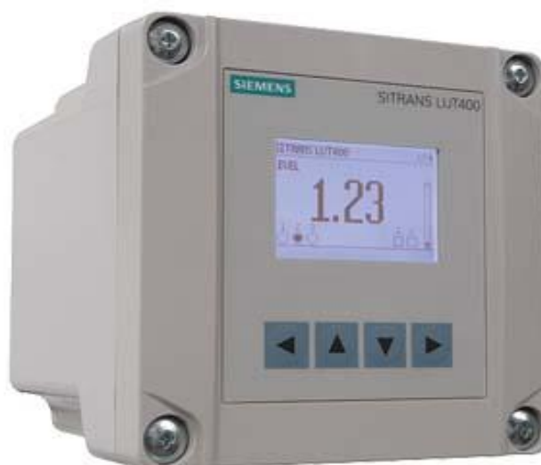
Рисунок 1 — Электронный блок уровнемера

Уровнемеры состоят из электронного блока и ультразвуковых преобразователей. Преобразователи и электронный блок соединены между собой линиями проводной связи. Общий вид электронного блока уровнемера приведен на рисунке 1. Общий вид ультразвуковых преобразователей приведен на рисунке 2.