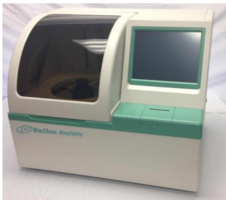
Рисунок 1 – Внешний вид анализатора автоматического биохимического и иммуноферментного BioChem Analette