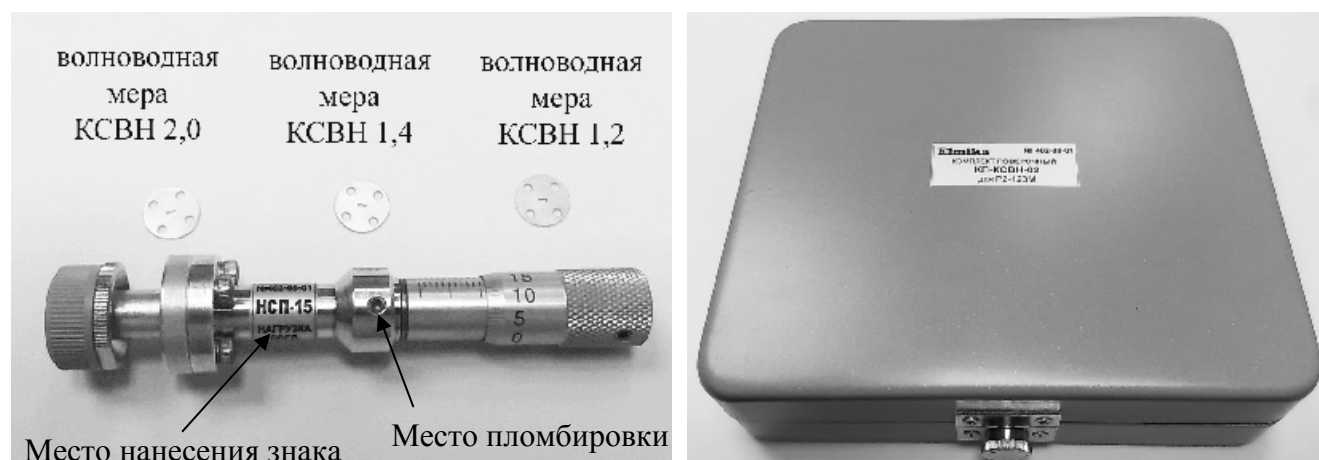
Рисунок 2 – Внешний вид измерителя