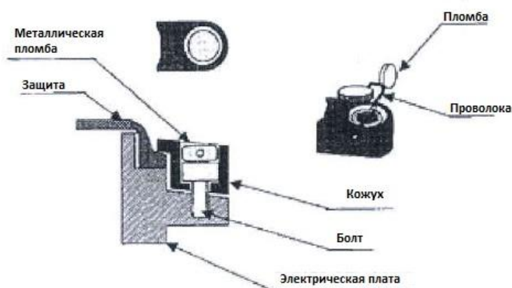
Рисунок 2 - Ограничение доступа к электрическим частям систем