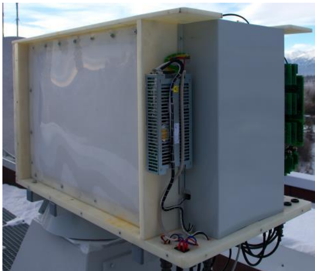
Рисунок 2 – Термостатируемый контейнер