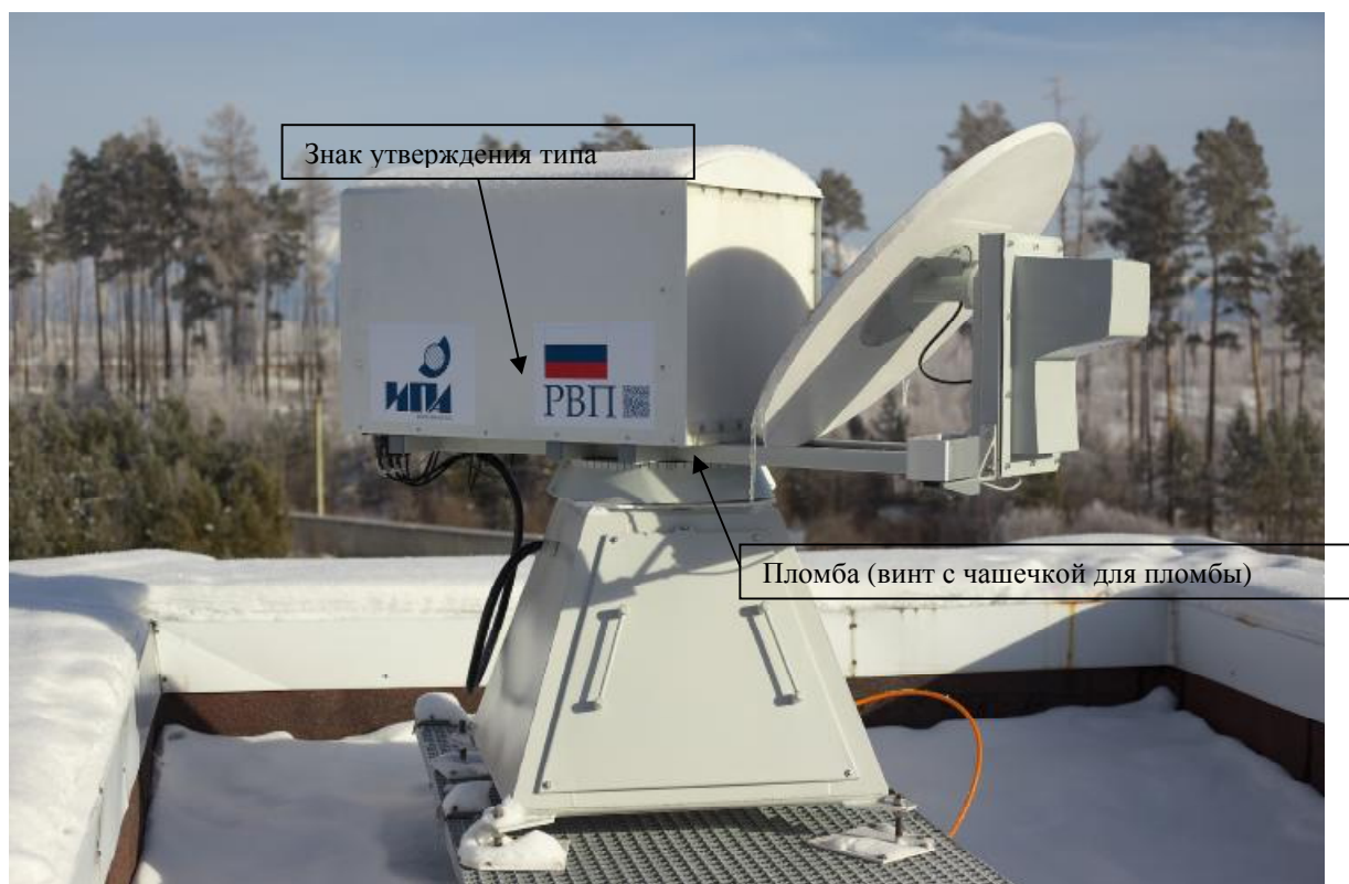
Рисунок 1 – Внешний вид радиометра водяного пара