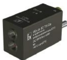
Рисунок 3 - Внешний вид фотодатчика ФД-2