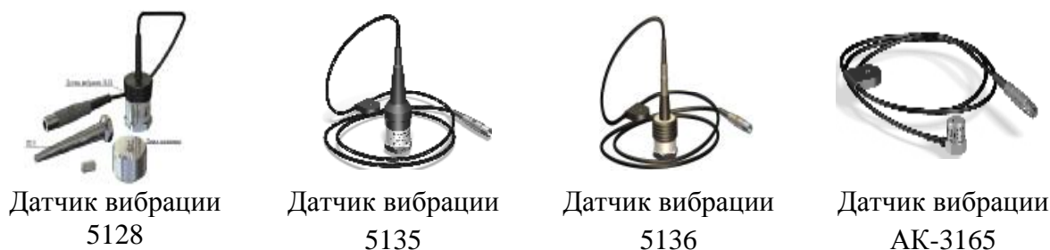
Рисунок 2 - Внешний вид датчиков вибрации 5128, 5135, 5136 и АК-3165