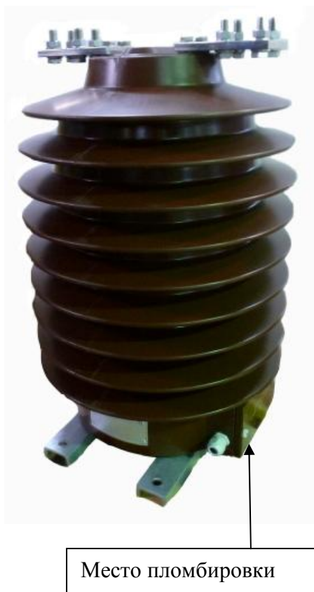
Рисунок 1 – Фотография внешнего вида трансформаторов тока