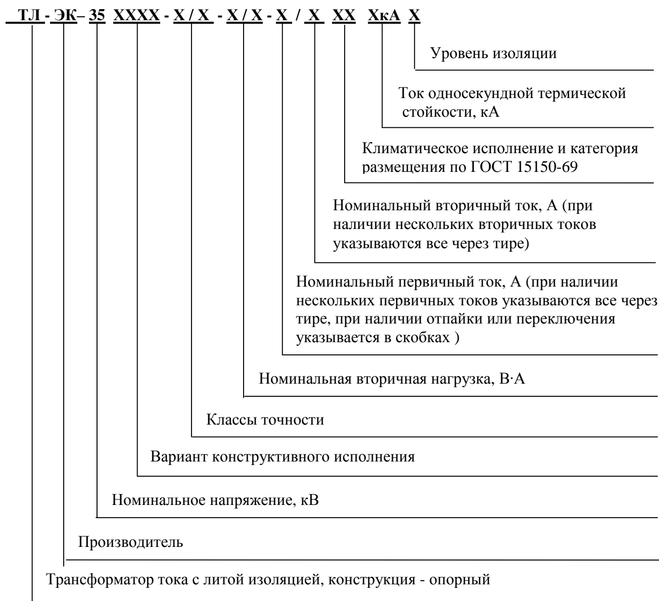
Рисунок 3 – Расшифровка условного обозначения трансформаторов