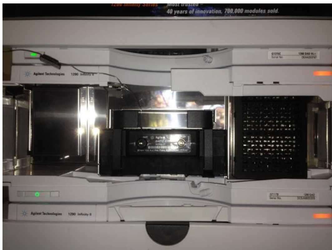
Рисунок 2 - Внешний вид детектора DAD (со снятой передней крышкой стойки)