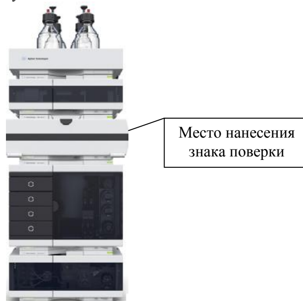
Рисунок 1 - Внешний вид хроматографа жидкостного 1290 Infinity II LC (внешний вид зависит от включенных в систему модулей)

Внешний вид хроматографа приведен на рисунке 1; пример внешнего вида отдельных модулей в увеличенном виде показан на рисунках 2 и 3.