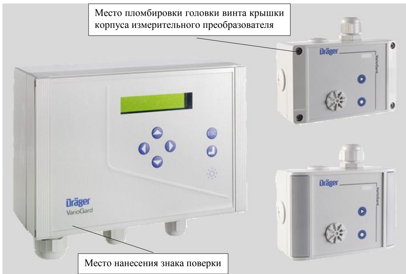
Рисунок 4 – Место нанесения знака поверки и пломбирования от несанкционированного доступа