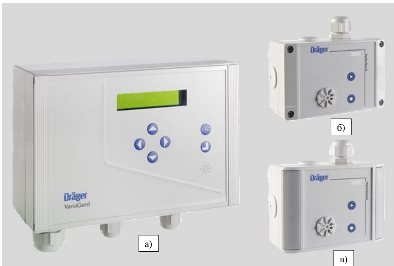
а) – центральный контроллер, б) – преобразователь измерительный в пластмассовом корпусе, в) - преобразователь измерительный в алюминиевом корпусе

Внешний вид системы приведен на рисунках 1 и 2. Структурная схема системы показана на рисунке 3. Место пломбировки корпуса преобразователя измерительного от несанкционированного доступа и место нанесения знака поверки показаны на рисунке 4 (знак поверки наносится в том случае, если условия эксплуатации обеспечивают сохранность знака в течение всего интервала между поверками).