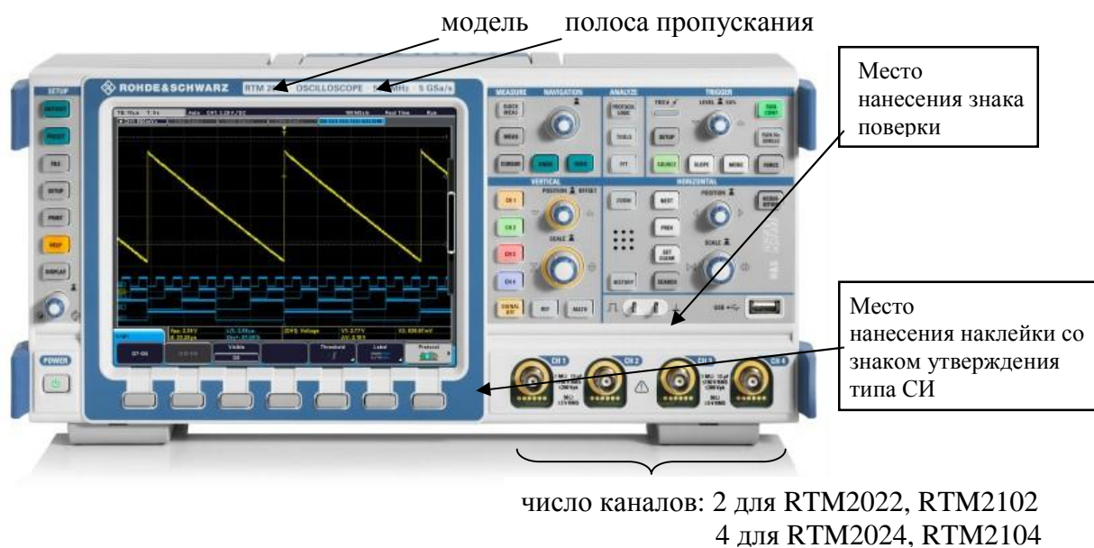
Рисунок 1- Внешний вид осциллографов цифровых запоминающих RTM2022, RTM2024, RTM2102, RTM2104

Схема пломбировки от несанкционированного доступа и обозначение мест для размещения наклеек приведены на рисунке 2.