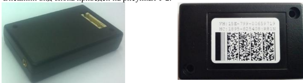
Рисунок 1 – Общий вид блока

Внешний вид блока приведен на рисунках 1-2.