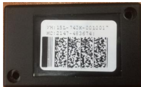
Рисунок 1 – Общий вид блока