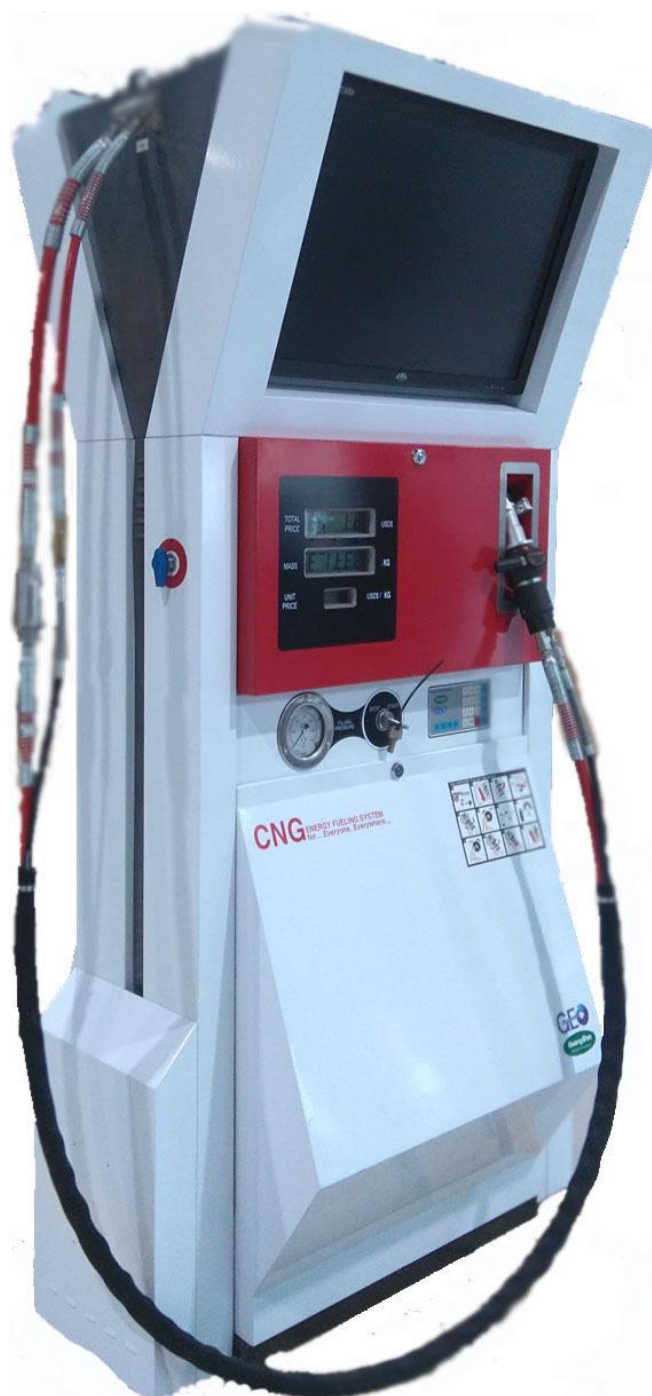
Рисунок 1 - Общий вид установок EFCR

Маркировка взрывозащищенности установок 1ExdibmIIAT3.